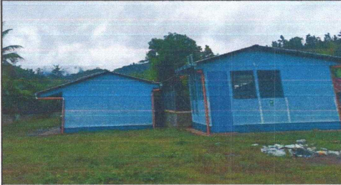
Foto 1: Se puede observar en las paredes de la escuela y de la cocina el deterioro de la pintura.