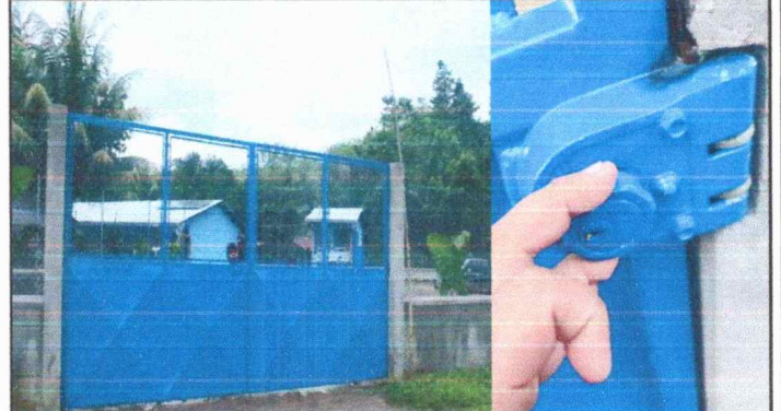
Foto 2: Se observa el portón que solo se cierra con presión, se dañaron las chapas tanto del portón como de la puerta de emergencia.