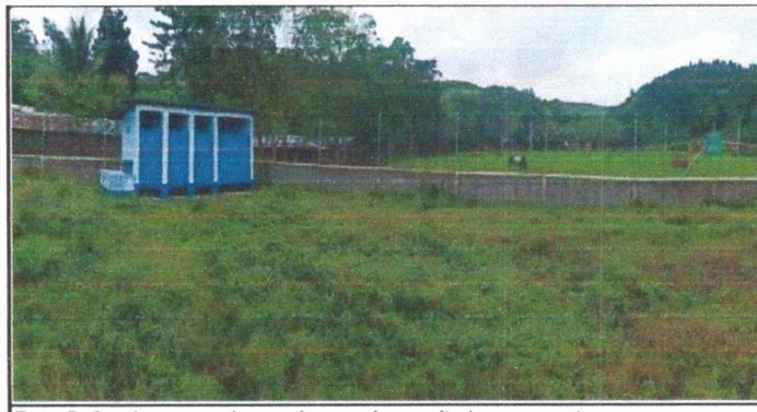
Foto 5: Se observa en la esquina que los sanitarios no cuentan con agua entubada.