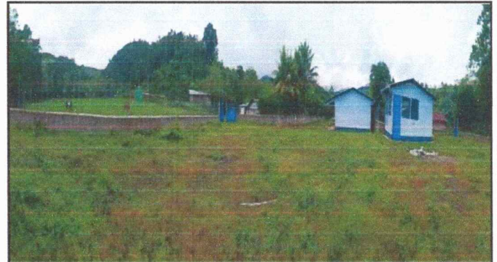
Foto 4: Se puede en la fotos que el enmallado no cuenta con alambrado para el buen cuidado del mismo.