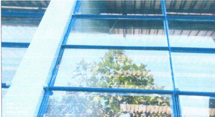
Foto 3: Se puede observar que hay varios vidrios quebrados y bases en mal estado